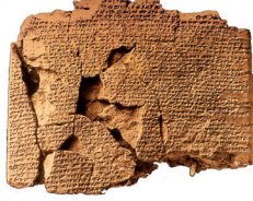
Kadeş Barış Antlaşması

Yukarıdaki kaynaklar hakkında bilgiler elde etmek isteyen tarihinin;